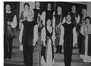
Členové komorního sboru Musica Bohemica.

Posluchače svými skladbami pozvou do období baroka a klasicismu, které interpretují především. Nechybí však ani česká anonymní a lidová tvorba a soudobé skladby. Věnují se také tradičním českým svátkům. (jp)