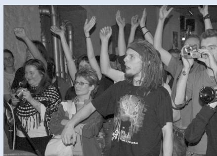
naslouchat, poté jej rozproudil pořádnou dávkou grunge rocku.