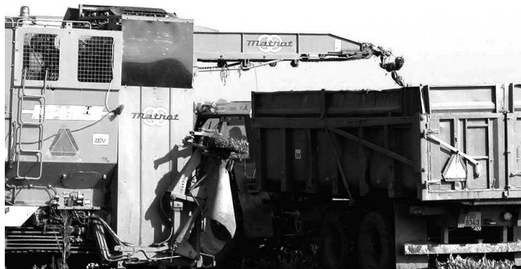
V důsledku plánovaného rušení některých cukrovarů a následného ukončení pěstování cukrové řepy hrozí podle mnohých zemědělců naší republiky nedostatek cukru.